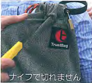
ナイフで切れません

見た目は何の変哲も無い普通のデイバッグ（リリユックサック）です。色も地味な色で目立ちません。しかし価格は149米ドル（1万5千円）もしてハイテク機能満載だと言います。生地素材は高分子ポリエチレン及び他の最先端技術による繊維を使用して作られておりナイフで切ったりのノミで穴を開けることが出来ません。更にこの素材は高周波を遮蔽する高い能力を持つ為にバッグの中に入れたICカードやデジタル機器の情報を完全に保護します。触感も非常に柔らかく防水も施され専用の鍵も付いています。