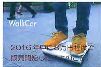
2016年中に8万円程度で販売開始したとのこと