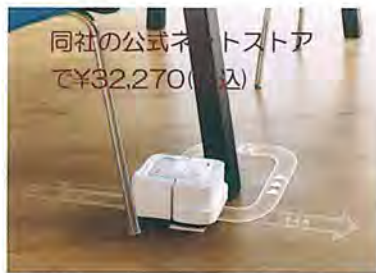
同社の公式ネットストアで¥32,270(税込)

自動掃除機「ルンバ」が今後買いたい家電の上位に常にランクされるようになって来ました。ルンバを開発したアイロボット社が、今年8月4日に床拭きロボット掃除機『ブラーバジェット240』を発表しました。同商品は、水を霧吹きのように床に噴出し、専用のクリーニングパッドを振動させながら汚れを拭き取るのが特徴。雑巾掛けは手間がかかって重労働のため主婦の要望は非常に高かったものの開発には多くの困難が伴い、今般ようやく商品化出来ました。大きさはルンバより一回り小さく、バッテリーチャージャーで充電して使います。