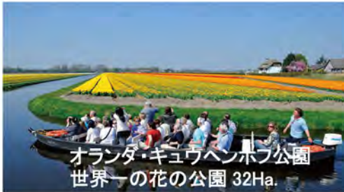
オランダ・キュウヘンホフ公園 世界一の花の公園 32Ha.