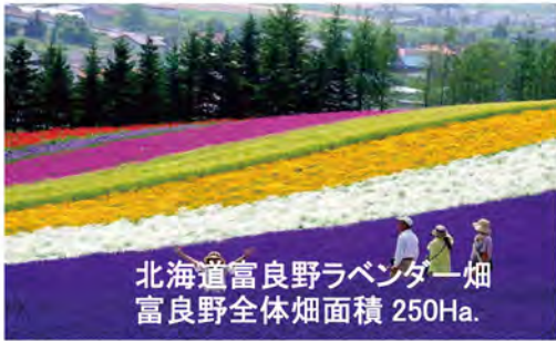
北海道富良野ラベンダー畑 富良野全体畑面積 250Ha.