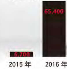
国内ウェアラブル端末 検出数推移

マホの発達により情報化社会の恩恵を間違いなく受けておりますが、逆に脅威にも晒される時代になって参りました。情報を正しく理解して