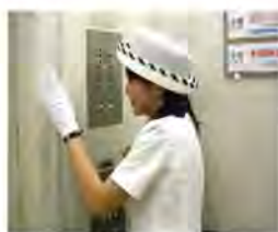
エレベーターガール：昔はこういう仕事もありました

過去10年間で消えた職業もありますが、ユーチューブへの投稿で生計を立てるユーチューバーなど新しい職業もどんどん出て来ています。経営者の端くれとして益々変化が激しくなり、新しいことが次から次に生まれてくるこの時代に生き残る事を幸せに思います。