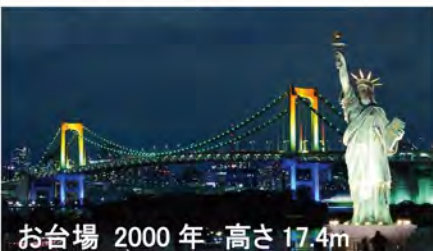
お台場 2000 年 高さ 17.4m