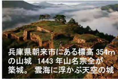
兵庫県朝来市にある標高 354m の山城 1443 年山名宗全が築城。雲海に浮かぶ天空の城