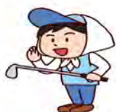
キャディーさんも少なくなりました