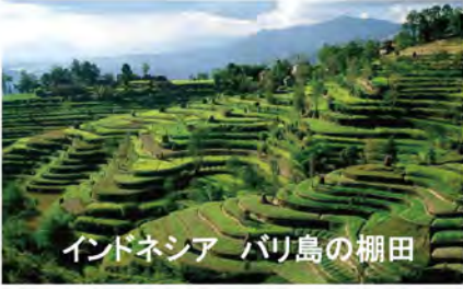
インドネシア バリ島の棚田