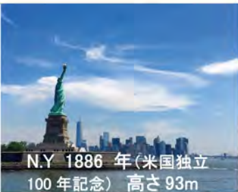
N.Y 1886 年(米国独立 100 年記念) 高さ 93m