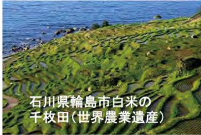
石川県輪島市白米の千枚田(世界農業遺産)