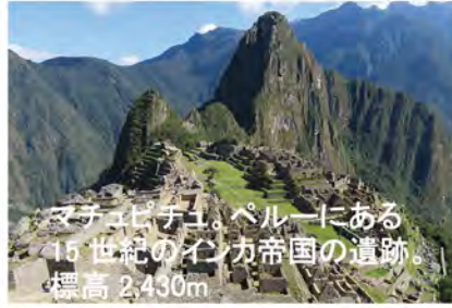
マチュピチュ。ペルーにある15世紀のインカ帝国の遺跡。標高 2,430m