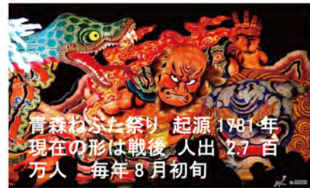
青森ねぶた祭り 起源 1781 年 現在の形は戦後 人出 2.7 百万人 毎年 8 月初旬