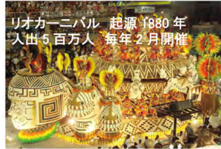
リオカーニバル 起源 1880 年 人出 5 百万人 毎年 2 月開催