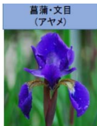
菖蒲・文目 (アヤメ)