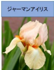
ジャーマンアイリス