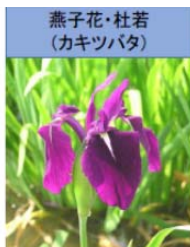
燕子花・杜若 (カキツバタ)