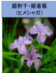
姫射干・姫著莪 (ヒメシヤガ)