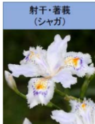
射干・著莪 (シヤガ)