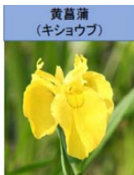
黄菖蒲 (キショウブ)