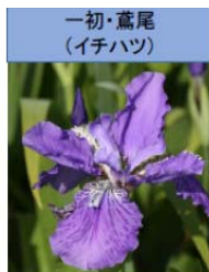
一初・鳶尾 (イチハツ)