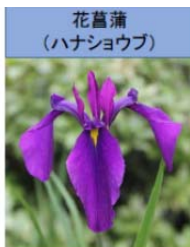
花菖蒲 (ハナショウブ)

の10種類のアヤメ科の花々です。さて源頼政の句の意味ですが、どれも美人で甲乙付けがたいという意味です。花に例えてとっさに優雅な切り返しが出来る教養が滲み出ています。皆様は「燕子花」とか「射干」とか読めますか? 「カキツバタ」「シヤガ」と読みます。難解ですがワープロの漢字変換でも出てきます。