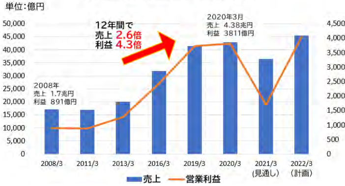
大和ハウスグループ売上・利益推移

② 上記のグラフが示すように2021年3月期の売上・利益はコロナの影響により減少していますが、10年前の2008年3月から増収・増益を続けています。