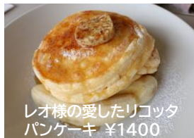
レオ様の愛したリコッタパンケーキ ¥1400

bill'sの名前を世界的に知らしめたのは米国人俳優のレオナルド・ディカプリオです。豪州シドニーで撮影中にこの店のパンケーキを気に入り毎朝通ったそうです。その後、ニューヨークタイムズ紙面上で世界一の朝食と称され人気ブランドになりました。日本には2008年鎌倉七里ヶ浜に一号店が開店し今では銀座、原宿など8店舗あります。