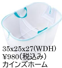
35x25x27(WDH) ¥980(税込み) カインズホーム