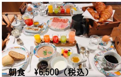
朝食 ¥6,500 (税込)

飲むサラダ5種類 生コンフィチュール ポトフ ジャンボブランド生ハム ヨーグルト タピオカオーレ プルーン 半熟卵 季節の果物 パン・フィナンシェ