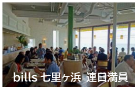
bill's 七里ヶ浜 連日満員