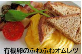
有機卵のふわふわオムレツ