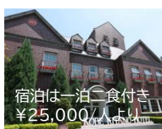
宿泊は一泊二食付き ¥25,000/人より